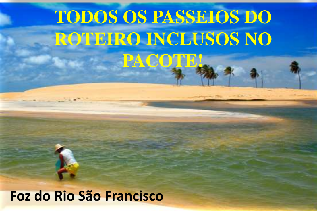
Foz do Rio São Francisco

TODOS OS PASSEIOS DO ROTEIRO INCLUSOS NO PACOTE!