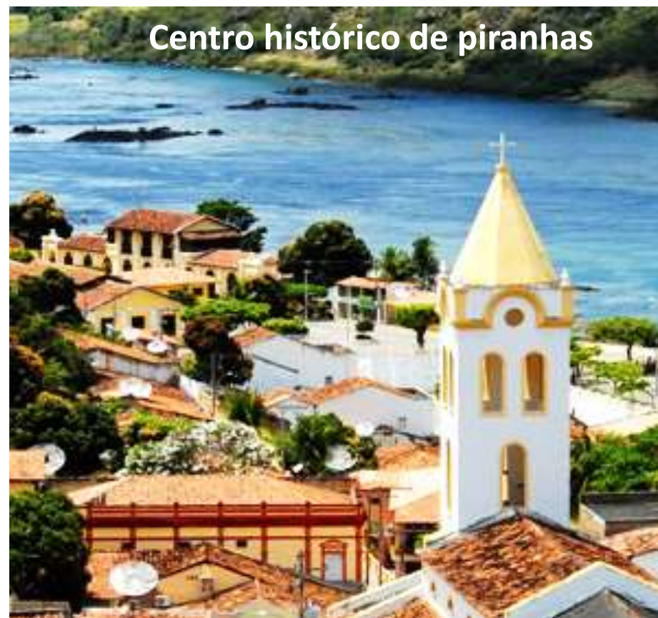
Centro histórico de piranhas